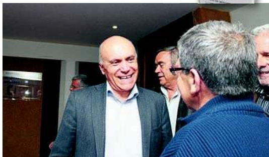
Jorge Vieira, presidente da Federação Portuguesa de Atletismo