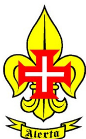
CNE Cruz 620