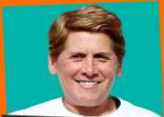
madrinha do evento aurora cunha ex-atleta campeã